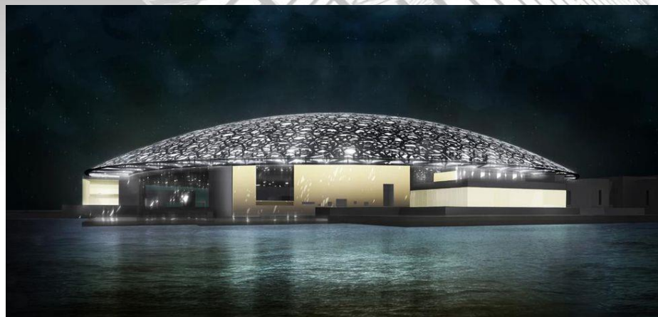
Le Louvre Abu Dhabi