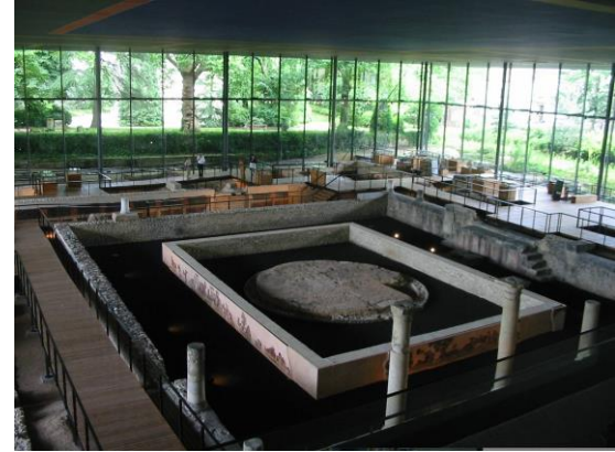
Le Musée Vesunna à Périgueux - 2003