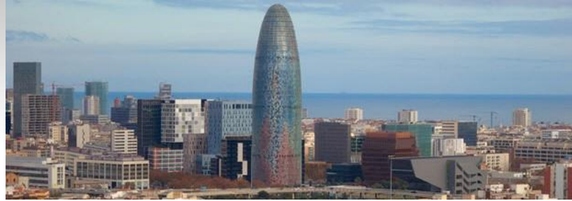
La Tour Agbar à Barcelone - 2005