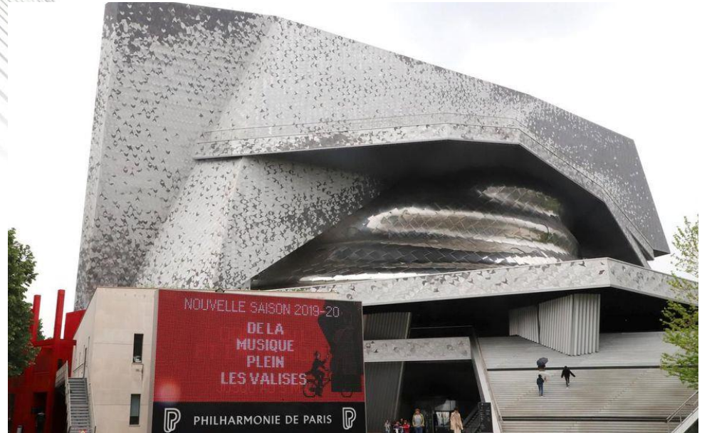
La Philharmonie de Paris 2015