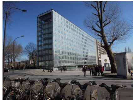
L'Institut du Monde Arabe à Paris - 1987